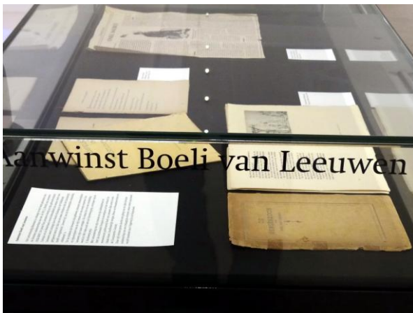
Vitrine in LM met vroegste publicaties van Boeli van Leeuwen.